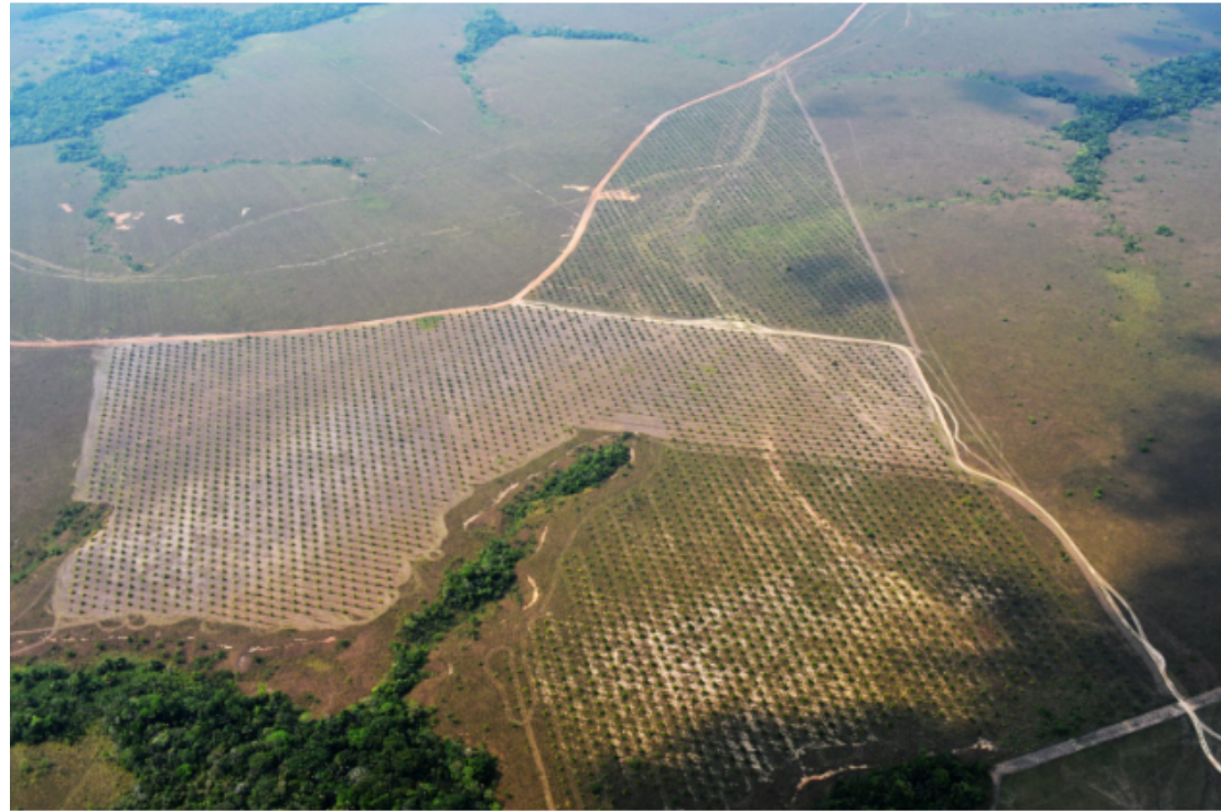
Palma ilegal en el departamento de Guaviare.