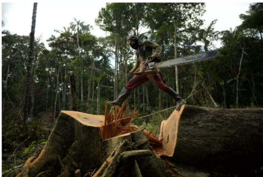
Un hombre tala un árbol para sembrar coca en el Guaviare, Colombia, el 6 de diciembre de 2021

En ocasiones, la institucionalidad argumenta que los conflictos entre campesinos e indígenas son un obstáculo central. Esto pone a los eslabones más frágiles de la cadena en tensión, mientras que los que se benefician de las grandes áreas deforestadas continúan avanzando en sus propósitos lucrativos.