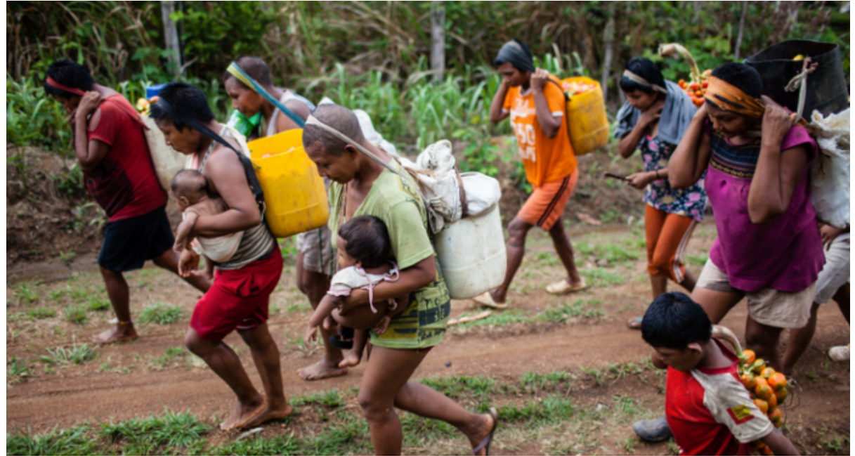
Según el último censo hay alrededor de 600 nukak y la mayoría no vive en su territorio ancestral.

Una de las principales órdenes se dirigió al Min. Ambiente, las CAR, Gobernación, Alcaldías y la Fuerza Pública, diseñar un plan de contención de la deforestación, así como la restauración ecológica de los corredores de movilidad de este pueblo y su retorno progresivo.