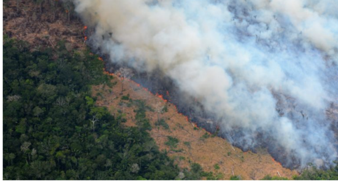
La destrucción de bosque dentro del Resguardo Indígena Nukak avanza cada día.