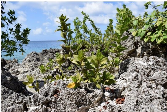
Figura 14. En medio de las esqueletos del camposanto brota la vegetación.

acidificación del mar. En conjunto, estos factores, aunque son procesos naturales, se han visto alterados por la crisis climática del Antropoceno. De hecho, en el Caribe colombiano, el incremento de la poblaciones isleñas, la rápida urbanización, la extracción de arena y coral para la construcción, el relleno de zonas de pantanos, la tala del manglar, y las construcciones de infraestructura que obstaculizan procesos naturales, son factores que, junto a la crisis climática global, han afectado los ecosistemas, causando mayor la erosión costera (INVEMAR, 2011), y ha creado parches de muerte como se es el caso del camposanto de corales.