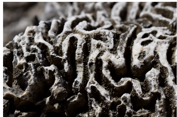
Figura 13. Vista panorámica del camposanto de corales, que a simple vista parecen muchas rocas sin mucha gracia, pero al acercarse es claro que se trata de coral.

Figura 12. Detalle de un coral cerebro muerto en el camposanto de corales.