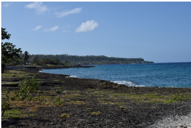
Figura 3. El paisaje estereotípico del paraíso tiene las características connaturales de los lugares isleños o costeros. Esta imagen fue tomada en San Andrés.

"It is not only 'goods' which circulated in the transatlantic world economy, but also people, texts, images, desires, and attachments." - Mimi Sheller.