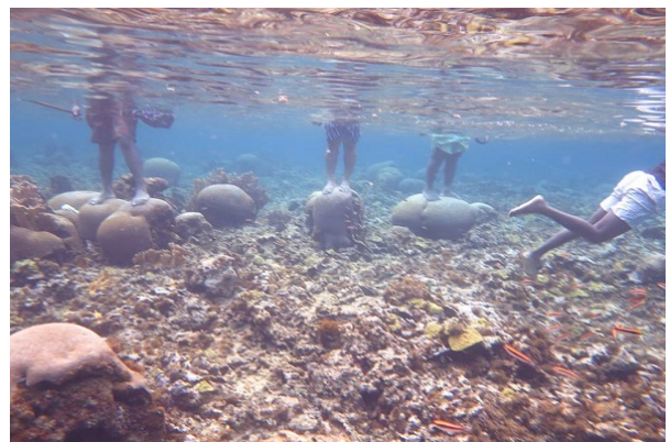
Figura 10. La posibilidad de visitar interactuar de manera irresponsable con ecosistemas frágiles resulta en interrupciones graves que conllevan a la muerte de los ecosistemas.

Nota. Tomada de Sigue agresión contra Little Reef, ahora se roban una Boya, por El Isleño., 2020.