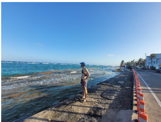
Figura 11. La erosión costera expresada en la pérdida de la línea de costa en la Isla de San Andrés justo al lado de la vía principal de isla.

Al encontrar el camposanto de corales en una de las zona de acantilados que rodean la Isla de San Andrés, y que inspiraron este texto, supuse que este