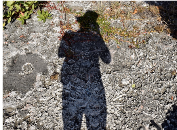
Figura 15. Esta fue primera fotografía de la serie del camposanto de corales en San Andrés.

Las imágenes del camposanto de corales son un punto de reflexión sobre la muerte, el paraíso, y la crisis medioambiental, porque es producto de la crisis climática, y porque se encontraban en tierra firme. Muchos de los efectos del cambio climático sobre los arrecifes y el mar no son visibles o perceptibles para las personas que no habitan estas geografías, o que no tienen conocimientos sobre los signos de degradación ambiental.