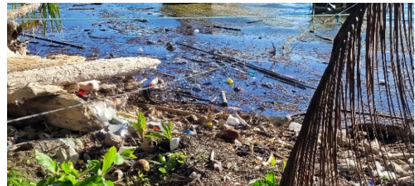
Figura 6. La polución hace parte del paraíso en la era del Antropoceno.

invertebrados comunes en las cálidas aguas del mar caribe. En los días siguientes visité las playas y tomé una noche de hotel en la Isla de Tintipán. En este hotel, estaba viviendo el estereotipo de lujo, relajación y consumo de la naturaleza en el sentido de Sheller (2003): hedonista.