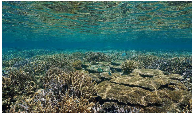
Figura 16. Un arrecife de coral vivo.