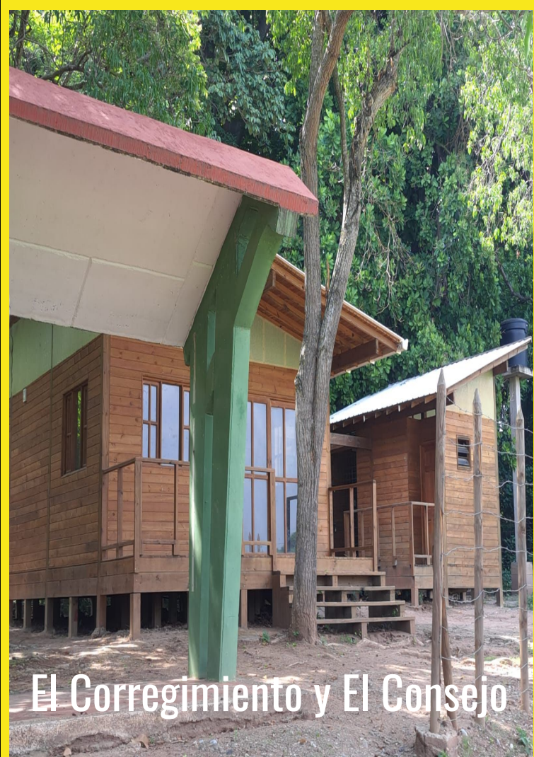
El Corregimiento y El Consejo