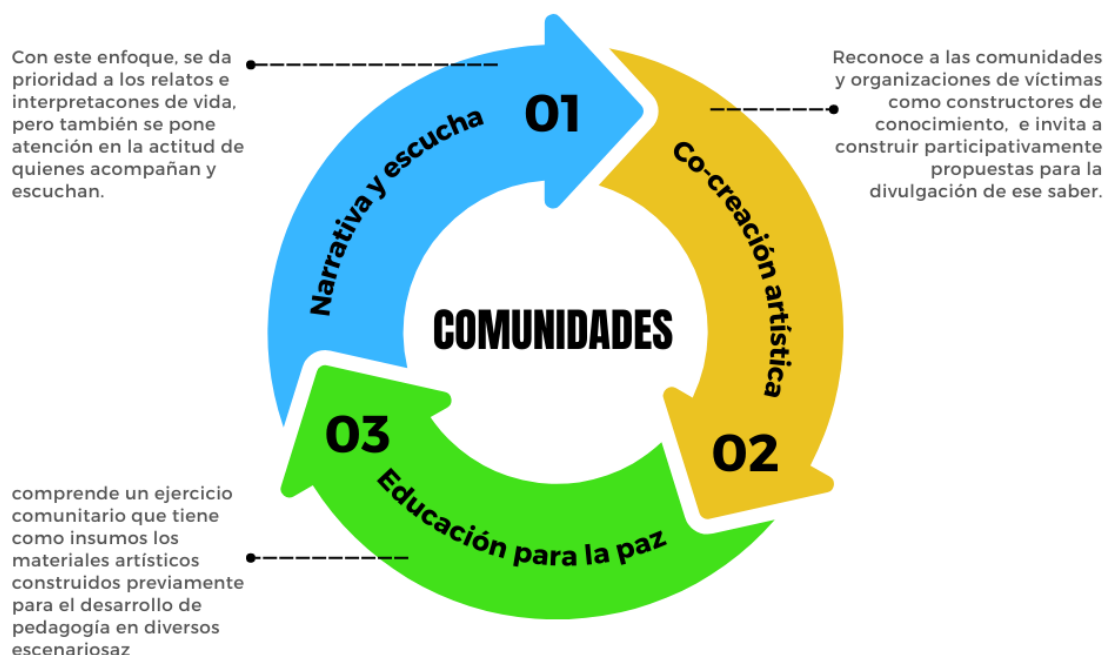
Gráfico 2: Componentes de la propuesta EntrelazARTE